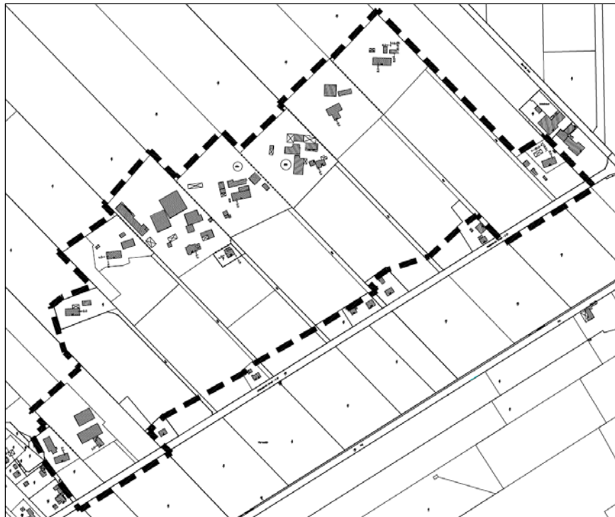
Abb. 1c: Räumliche Lage des Teilbereiches 3 (nicht maßstäblich)