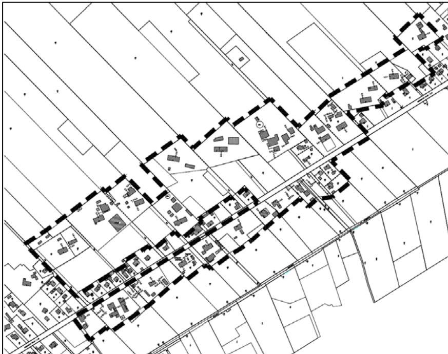
Abb. 1b: Räumliche Lage des Teilbereiches 2 (nicht maßstäblich)