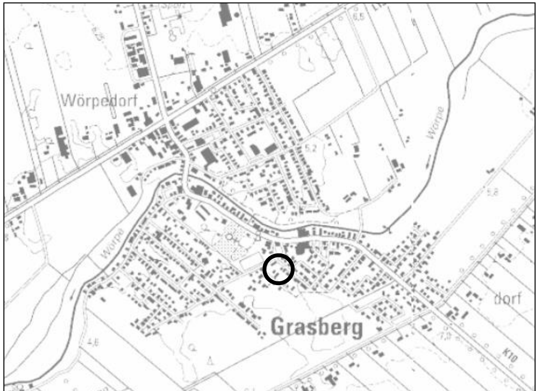
Abb. 1: Räumliche Lage des Bebauungsplanes Nr. 1 "Grasberg-Alt", 2. Änderung

Der Bereich der vorliegenden Bauleitplanung liegt im Süden des Hauptortes der Gemeinde Grasberg an der Straße Am Berg. Die räumliche Lage des Plangebietes ist nachfolgend in Abbildung 1 gekennzeichnet. Der Geltungsbereich der vorliegenden Änderung umfasst das Grundstück Am Berg 8 (Flurstück 25/39) mit einer Größe von ca. 1.501 m 2 und kann Abbildung 2 entnommen werden.