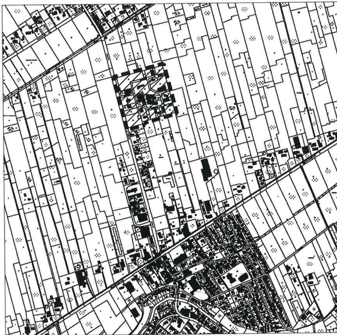
Abb. 1: Geltungsbereich (ohne Maßstab)