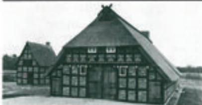
Zehn Jahre Vorbereitung: 2001 wurde der historische „Länderei“ eingeweiht.

Geologie · Baugeschichte · Länderei · Orts- und Kreisgeschichte · Einzelorte · Schreinerkunst · Wappkunde · Braut- und Hochzeit · Festschreiben · Totenkunst