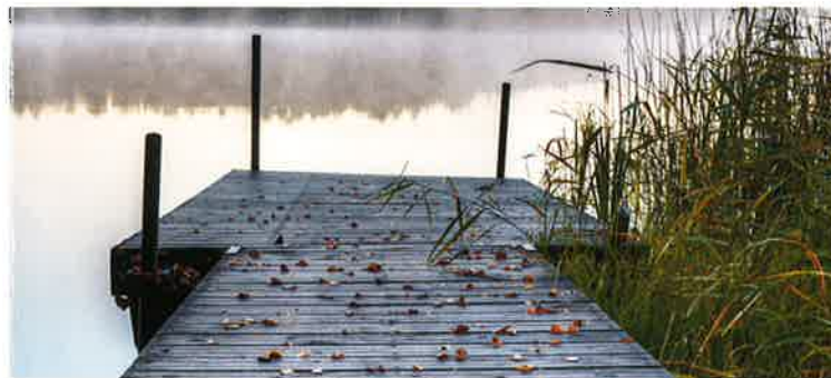
Steganlage an der Wörpe

Soziale Kontakte gehören ins tägliche Leben. Wir möchten Plätze schaffen, an denen wir uns austauschen können.