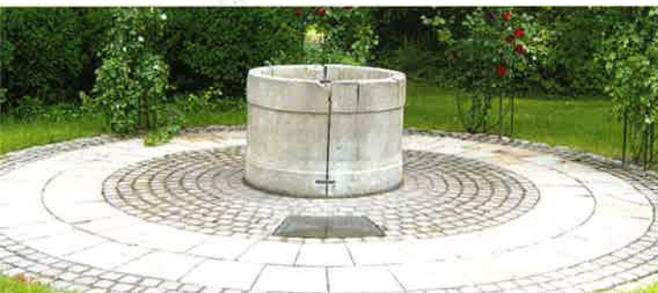
Sandsteinbrunnen vor dem Rathaus

Aus dem Stiftungskapital werden im Rahmen der jährlichen Zinsen die Zuwendungen für die Stiftungszwecke gewährt oder auch eigene Maßnahmen finanziert.