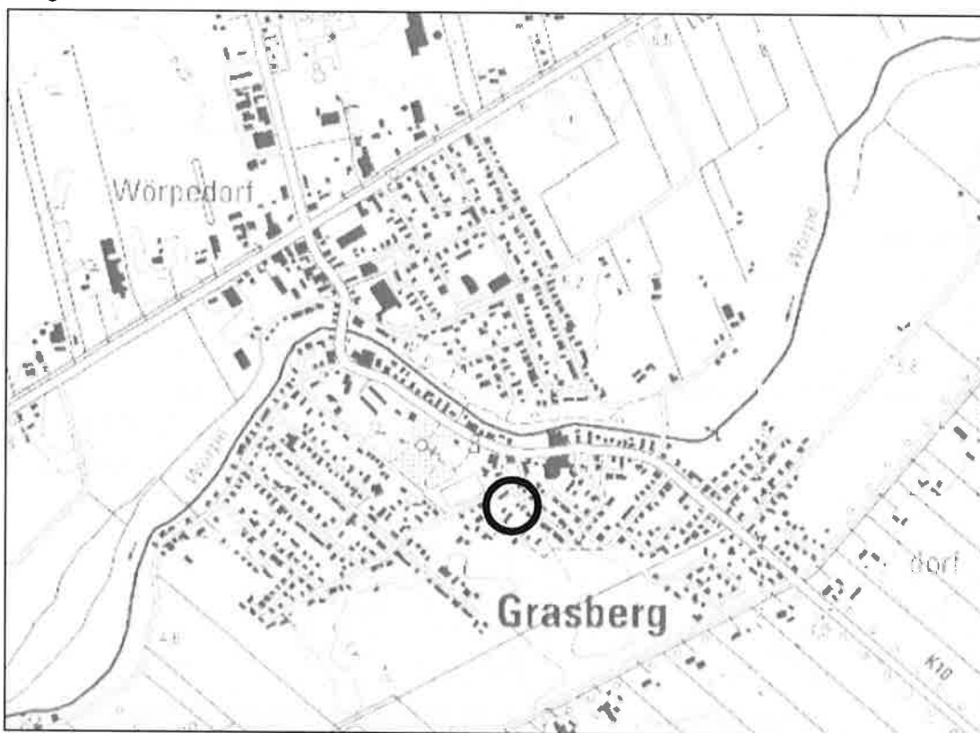
Abb. 1: Räumliche Lage des Bebauungsplanes Nr. 1 "Grasberg-Alt", 2. Änderung

Der Bereich der vorliegenden Bauleitplanung liegt im Süden des Hauptortes der Gemeinde Grasberg an der Straße Am Berg. Die räumliche Lage des Plangebietes ist nachfolgend in Abbildung 1 gekennzeichnet. Der Geltungsbereich der vorliegenden Änderung umfasst das Grundstück Am Berg 8 (Flurstück 25/39) mit einer Größe von ca. 1.501 m 2 und kann Abbildung 2 entnommen werden.